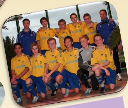
4. Platz Brøndby If Kopenhagen