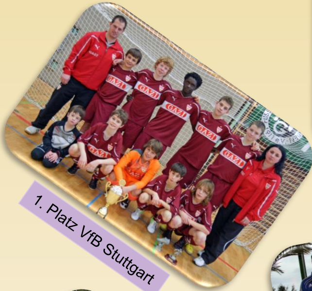
1. Platz VfB Stuttgart