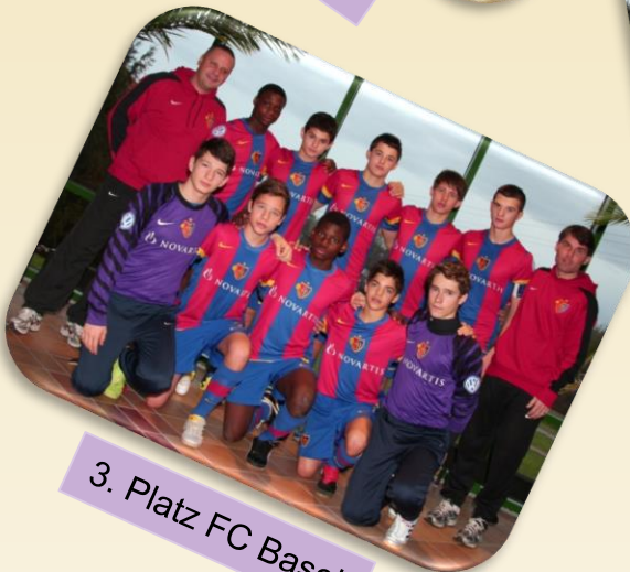
3. Platz FC Basel