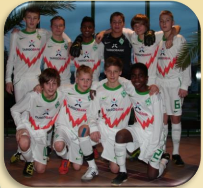
2. Platz Werder Bremen